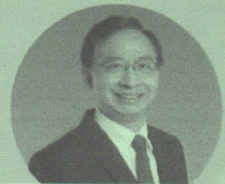
ดร.สุพจน์ เรียรวณี อดีตผู้อำนวยการสำนักงานพัฒนาเศรษฐกิจ